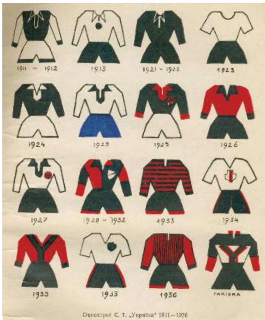
Vereinstrikots Ukraina L'viv / stroje sportowe klubu Ukraina Lwów

In Lemberg, so zeigt die Geschichte, haben Polen und Ukrainer, Juden und Deutsche, über Jahrzehnte zusammen (Fußball-)Geschichte geschrieben. Nicht immer reibungslos, nicht immer gemeinsam, aber doch stets eng verbunden. Was eine