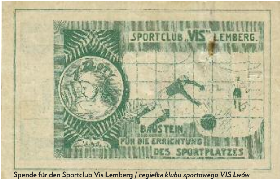
Spende für den Sportclub Vis Lemberg / cegiełka klubu sportowego VIS Lwów

Seine Fußballsektion trat nach einigen Freundschaftsspielen 1924 dem polnischen Fußballverband bei, um sich an den Meisterschaftsspielen der Lemberger Mannschaften zu beteiligen. Im Herbst 1925 gewann der Sportclub Vis die Meisterschaft in der untersten C-Klasse. Ein Jahr später wurde die Mannschaft auch in der B-Klasse Meister, verlor jedoch das Qualifikationsspiel zur höchsten Spielklasse der Region Lemberg. Ende der 1920er Jahre schrieb das „Ostdeutsche Volksblatt“ aus Lemberg von einem zunehmend nationalistisch motivierten unsportlichen Verhalten der gegnerischen Mannschaften, der Schiedsrichter und einiger Zuschauer. Aus diesem Grund zog sich der Sportclub Vis 1931 aus dem polnischen Fußballverband zurück und trug keine Meisterschaftsspiele mehr gegen polnische Mannschaften aus.